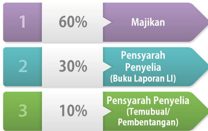
Rajah 3.1: Kriteria Penilaian LI.

Penilaian LI dibuat berdasarkan kriteria seperti dalam Rajah 3.1 dan Rajah 3.2.