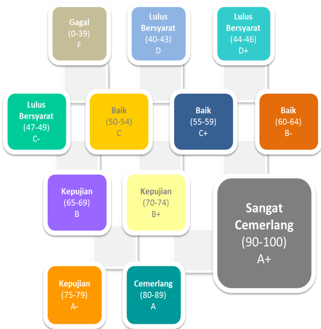
Rajah 3.3 : Gred Prestasi LI.

Prestasi LI ditunjukkan dalam bentuk gred seperti dalam Rajah 3.3.