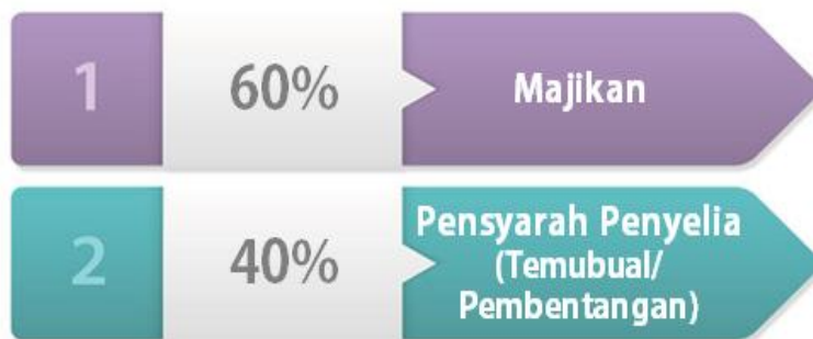
Rajah 3.2: Kriteria Penilaian LI (Sijil Asas Kolej Komuniti).