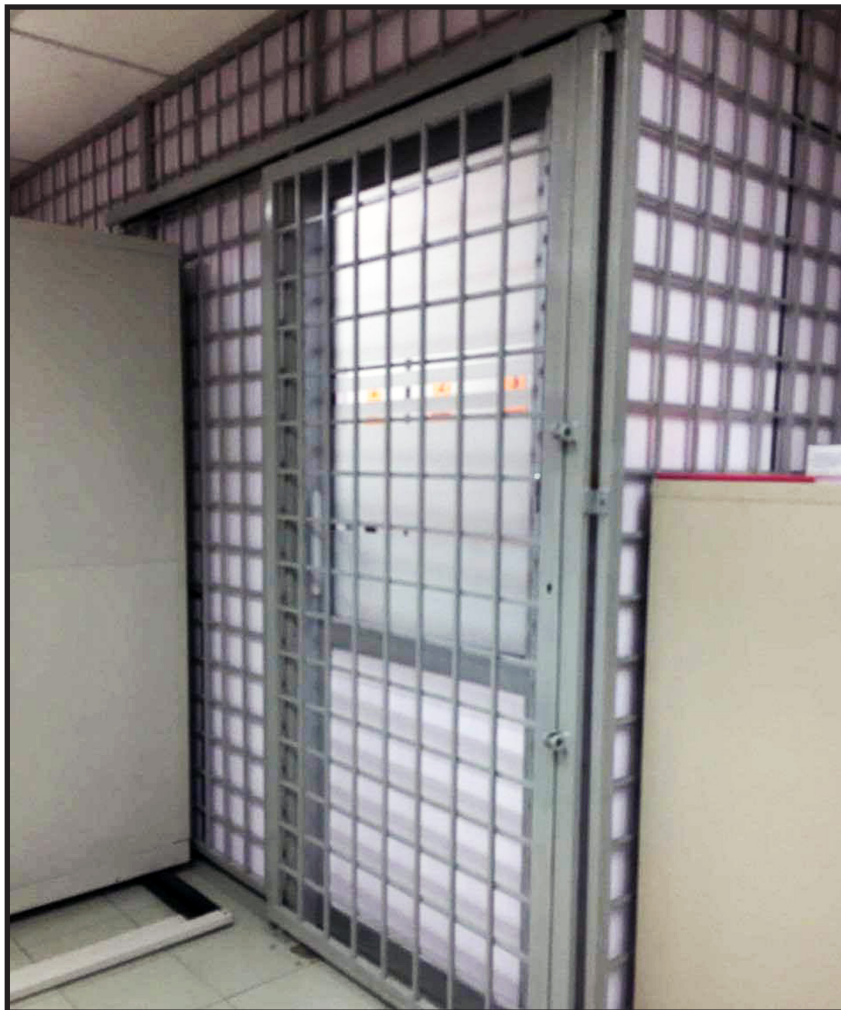
RAJAH 5.3: Contoh Binaan Bilik Kebal Yang Diubahsuai