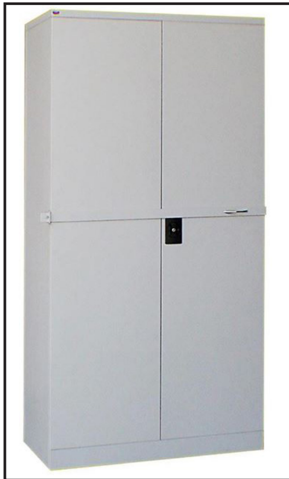
RAJAH 5.6: Contoh Almari Keluli Berpalang