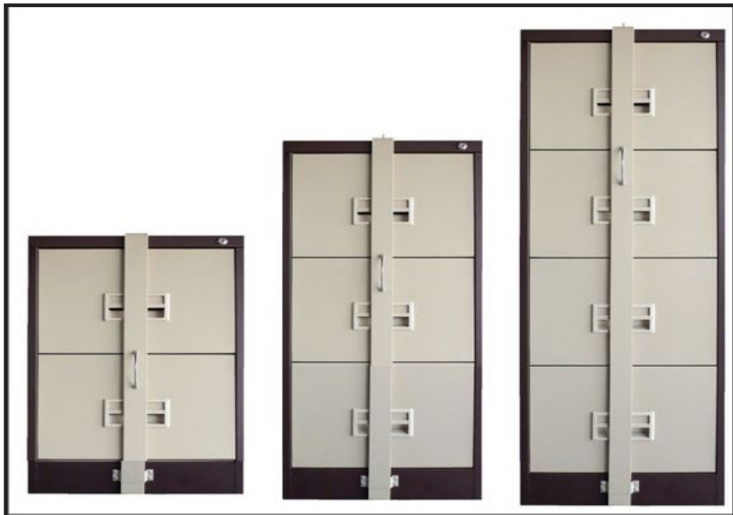
RAJAH 5.5: Contoh Kabinet Keluli Berpalang