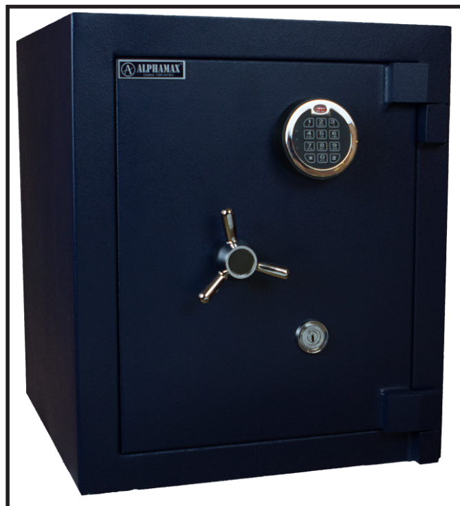
RAJAH 5.4: Contoh Peti Besi